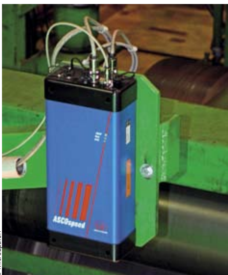
Abb. 6: ASCOSpeed als Geschwindigkeitsmaster

In addition to the mechanical equipment, Danieli Fröhling is also responsible for the plant electrics and automation. Besides the actual drive technology, it also supplies the Level 1 and Level 2 systems. The control and regulation functions of the Level 2 system are used, amongst other things, for online monitoring as well as for plant and process control in order to ensure the output and product quality of the plant. There are a large number of sets of parameters for setting up various applications with respect to material and alloy characteristics, strip thickness and speed settings and these offer the operator a high degree of comfort, and do so independently