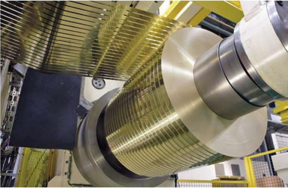
Fig. 5: Coiling of slit strip

Neueste Weiterentwicklungen von Fröhling zielten auf die Optimierung der Saugleistung des Systems, um sowohl die Energie-