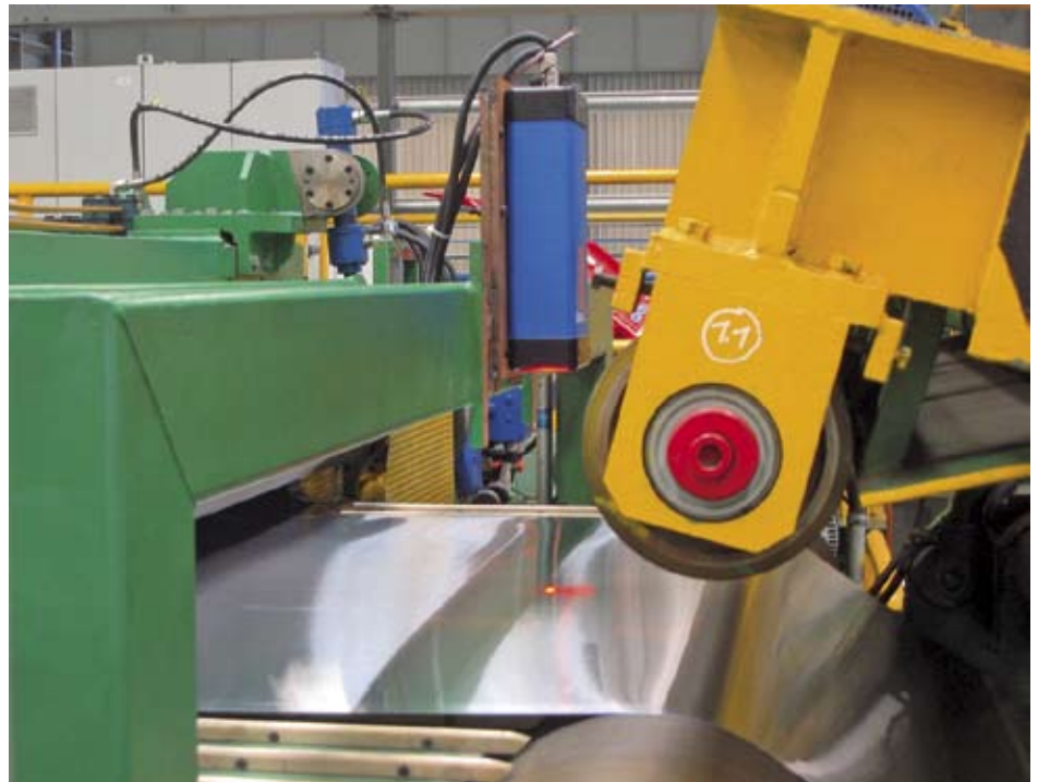
Abb. 7: ASCOSpeed-Installation an Hochgeschwindigkeitsbesäumschere Nanshan