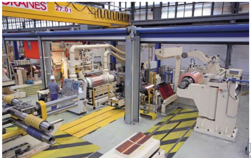
Abb. 1: Hochleistungsspaltanlage mit Vakuumrolle und Messerwechseinrichtung Fig. 1: High-performance slitter with vacuum roll and cutter-changing device

D. Neumann, Josef Fröhling GmbH & Co. KG; K. Christofori, Micro-Epsilon Optronic GmbH