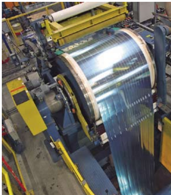
Abb. 4: Vakuumbremsrolle mit Blick auf die Band-Streifen in der Schlingengrube / Fig. 4: Vacuum brake roll with slit strip in the slack-loop pit

Das Bremsen (also das Aufbringen eines definierten Bandzuges) der Streifen erfolgte bis vor einigen Jahren standardmäßig durch Bandpressen, durch Bremsrollen oder sogenannte „Belt Bridles“. Alle diese Systeme haben den Nachteil, dass es zu einem starken Kontakt und Reibung zwischen Bremsmedium und Material kommt. Daraus können Beschädigungen oder Verschmutzungen der Bandoberfläche resultieren, die besonders bei Bändern mit erhöhten Anforderung (Elektronikindustrie, Dekoration, Bänder für Beleuchtungsanwendungen u. ä.) störend sind oder gar zum Ausschuss führen.